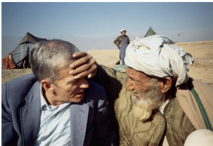
Bruder Andrew mit einem afghanischen Flüchtling

1955 ging ein Mann – der später unter dem Namen Bruder Andrew bekannt wurde – nach Osteuropa und lernte dort eine kleine christliche Gemeinschaft kennen, die ihr Dasein hinter dem Eisernen Vorhang fristete. Diese Reise sollte sein Leben verändern. Er stellte sich ganz in den Dienst von Christen in Not, indem er Bibeln schmuggelte, in westlichen Ländern über ihre Situation berichtete und die bedrängten Christen wissen